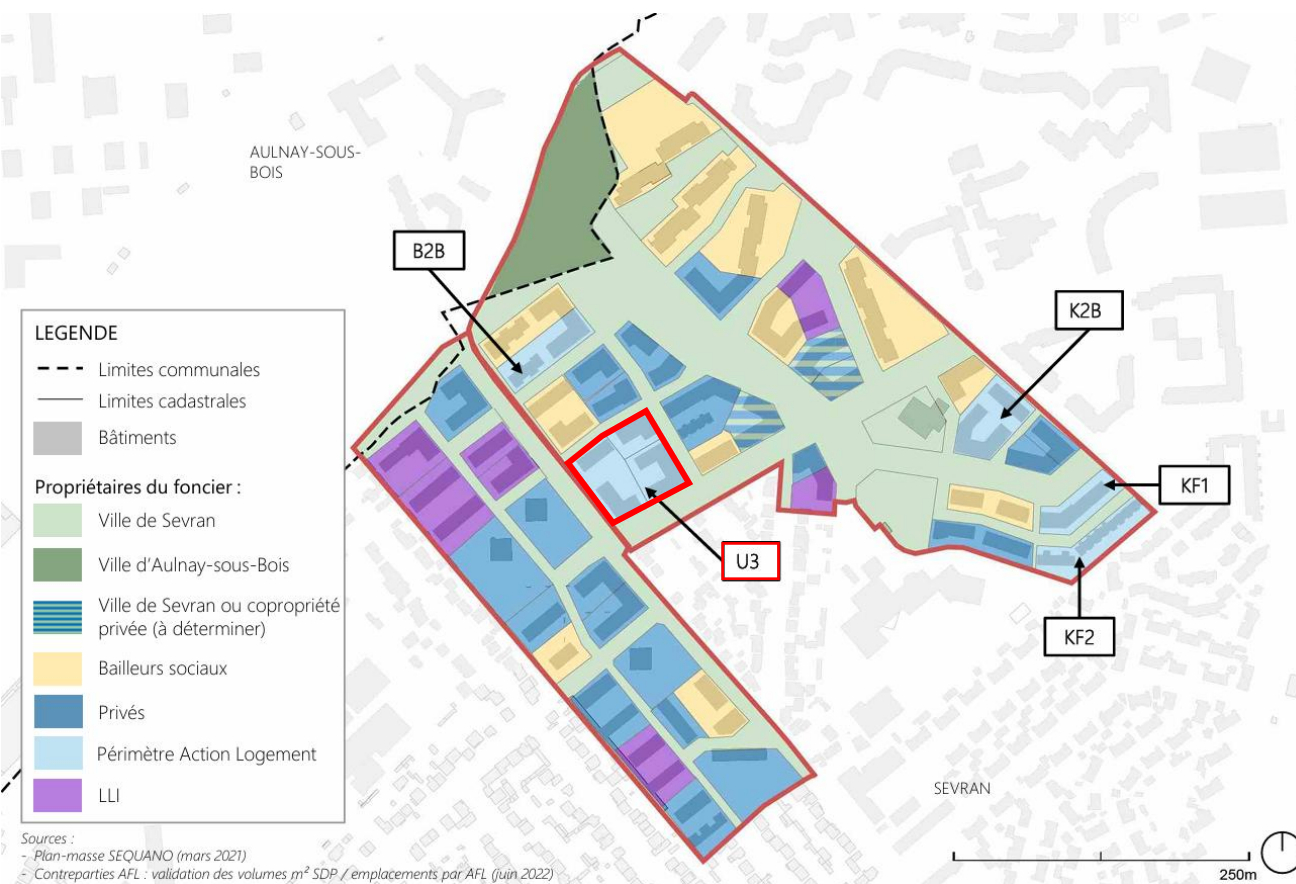
Localisation du terrain dans le quartier