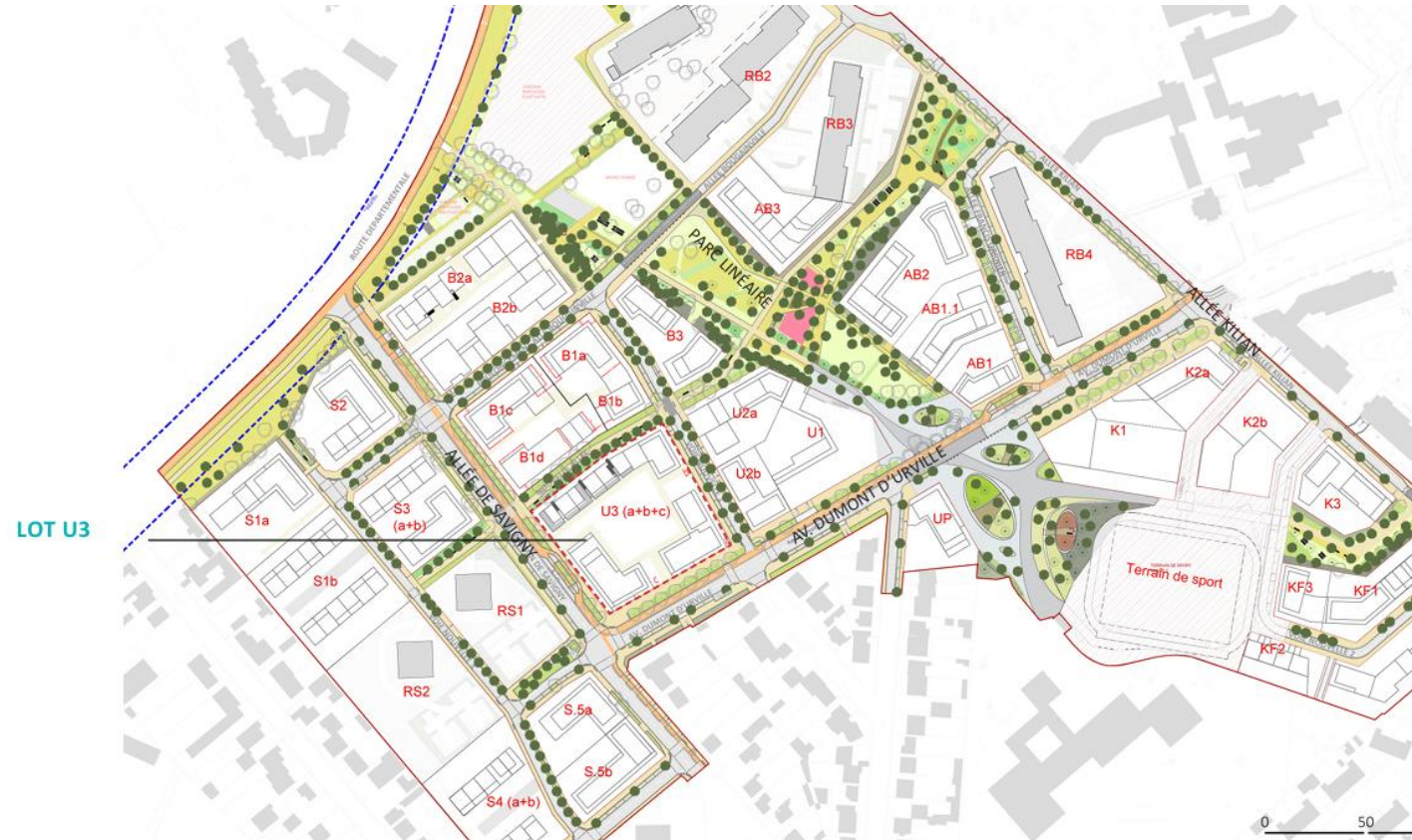
Localisation du projet dans le plan guide